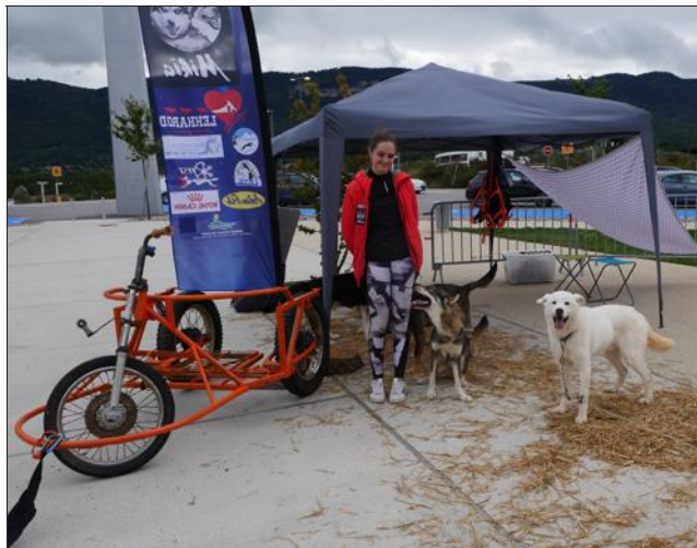
Des mini balades en traîneau (à roulettes) sont prévues ce vendredi après-midi.

Enfin, des démonstrations de recherche de