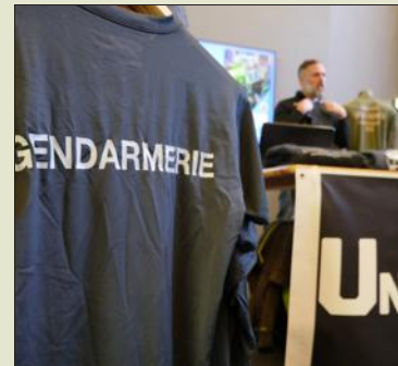
Les forces de l'ordre sont présentes en nombre pendant ces deux jours.

Un tel événement, rare à l'échelle hexagonale, a donc fait se déplacer des spécialistes originaires de toutes les régions de France et même de Suisse (jusqu'à Berne). Côté français, la quasi-totalité des services cynophiles des forces de l'ordre est présente via les différentes polices concernées (nationale et municipale), la gendarmerie, l'armée, les services des douanes, mais également la sécurité ferroviaire ou encore la Légion étrangère. Du côté helvétique, l'armée, les forces spéciales, les gardes frontalières et la police cantonale (Genève et Lausanne) sont présents, de même que les professionnels affectés à l'ONU.