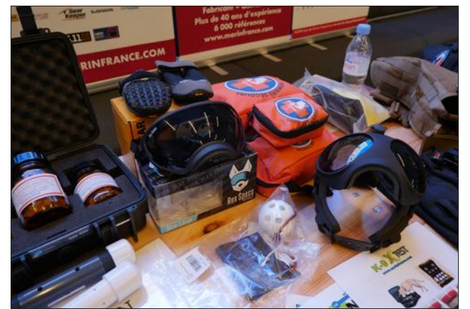
Gilet pare-balles, caméras, casque de protection, faux explosifs : l'univers du chien de police n'a décidément rien à envier à celui des humains.