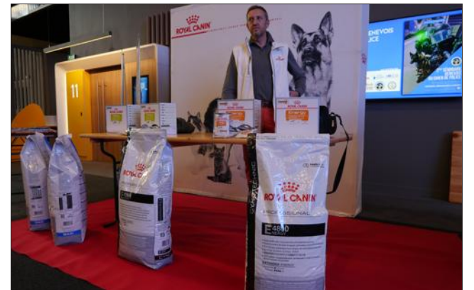
Chez Royal Canin, on a eu du flair... La société s'est en effet parfaitement positionnée auprès des professionnels en proposant des produits adaptés à leurs besoins. Sa gamme Energy et ses friandises Educ pour chiens au profil hypersportif ont trouvé un large écho chez les spécialistes.